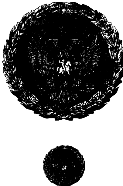
РИСУНОК НАГРУДНОГО ЗНАКА К ПОЧЕТНОЙ ГРАМОТЕ ПРЕЗИДЕНТА РОССИЙСКОЙ ФЕДЕРАЦИИ

Утвержден Указом Президента Российской Федерации от 11 апреля 2008 г. N 487