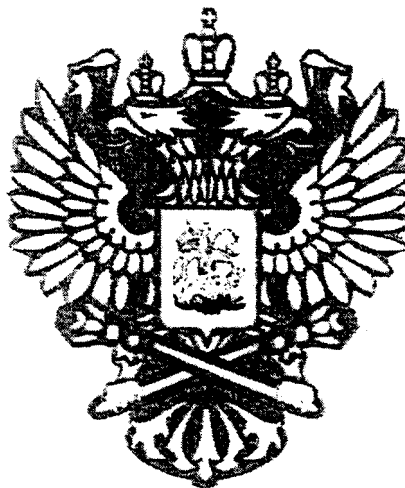
РИСУНОК НАГРУДНОГО ЗНАКА К ПОЧЕТНОЙ ГРАМОТЕ ПРАВИТЕЛЬСТВА РОССИЙСКОЙ ФЕДЕРАЦИИ